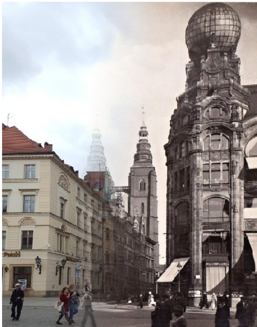
Dom Handlowy Braci Barasch wraz z nieistniejącym już globusem zamocowanym na dachu.