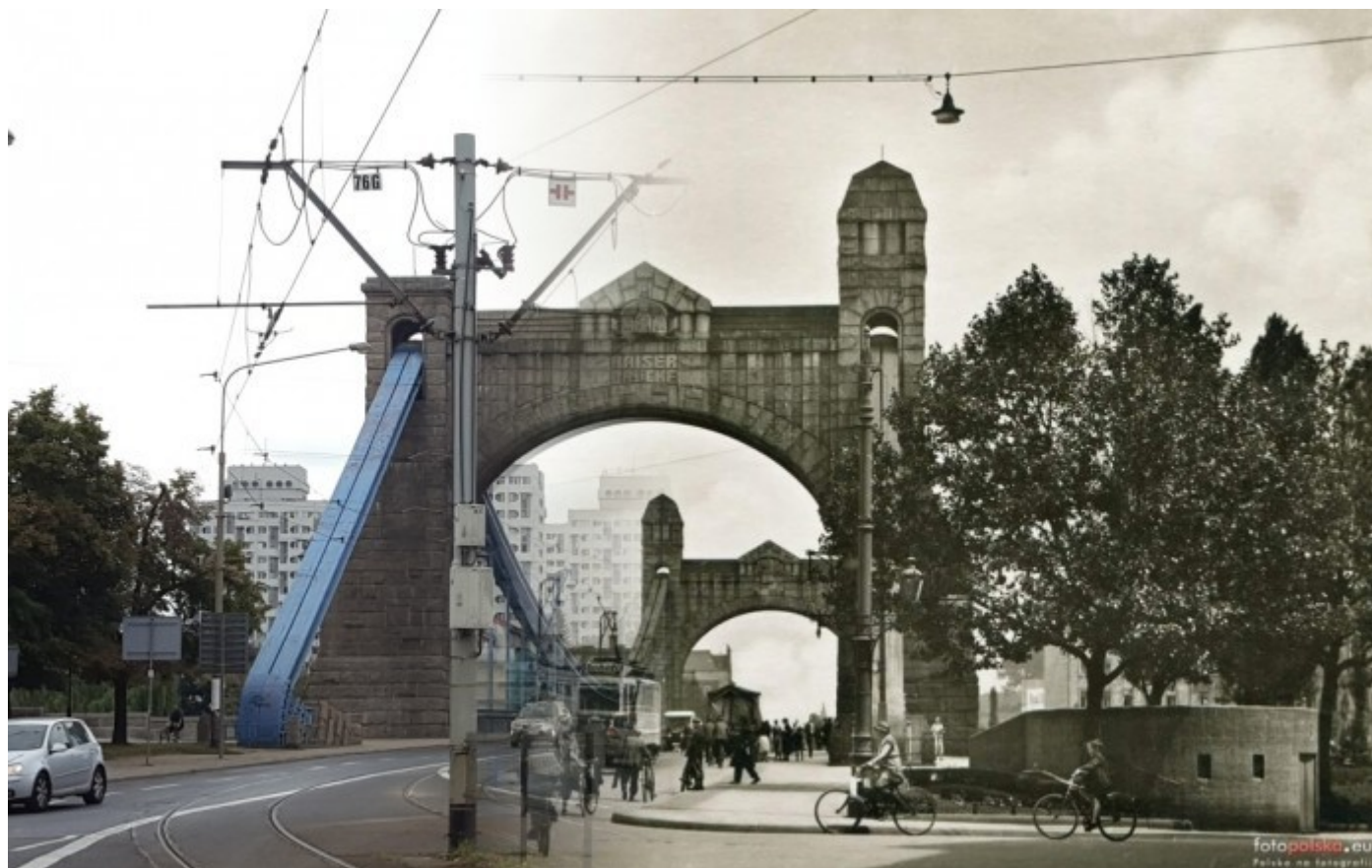
Most Grunwaldzki z przedwojennymi kolumnami