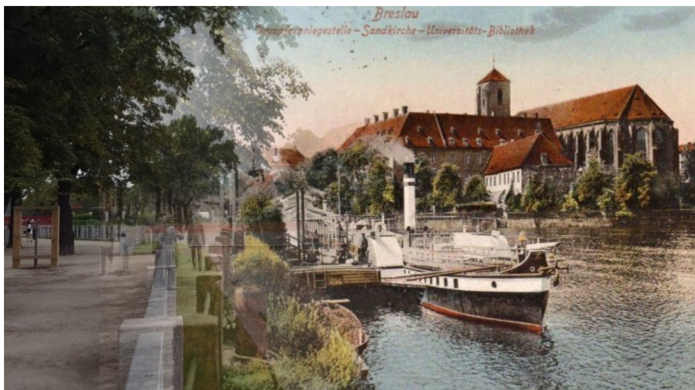
Bulwar Xawerego Dunikowskiego

Czy idąc ulicami Wrocławia nie zastanawiało was to jak wyglądało to miasto 130 lat temu? Jeśli odpowiedź jest twierdząca to fotografie Bartosza Wnęka powinny przy wam do gustu. Jak mówi sam autor – zdjęcia zostały wykonane „na żywo” poprzez nałożenie kartki pocztowej na miejsce, w którym działa się akcja. Moim założeniem było oddanie dawnego ducha miasta i porównanie go ze stanem obecnym. Czy się udało? Zapraszamy do przejrzania kilku prac Bartłomieja i skonfrontowania architektury dawnego Breslau z obecnym Wrocławiem.