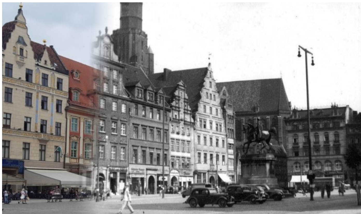
Zachodnia ściana rynku przed wojną i obecnie.