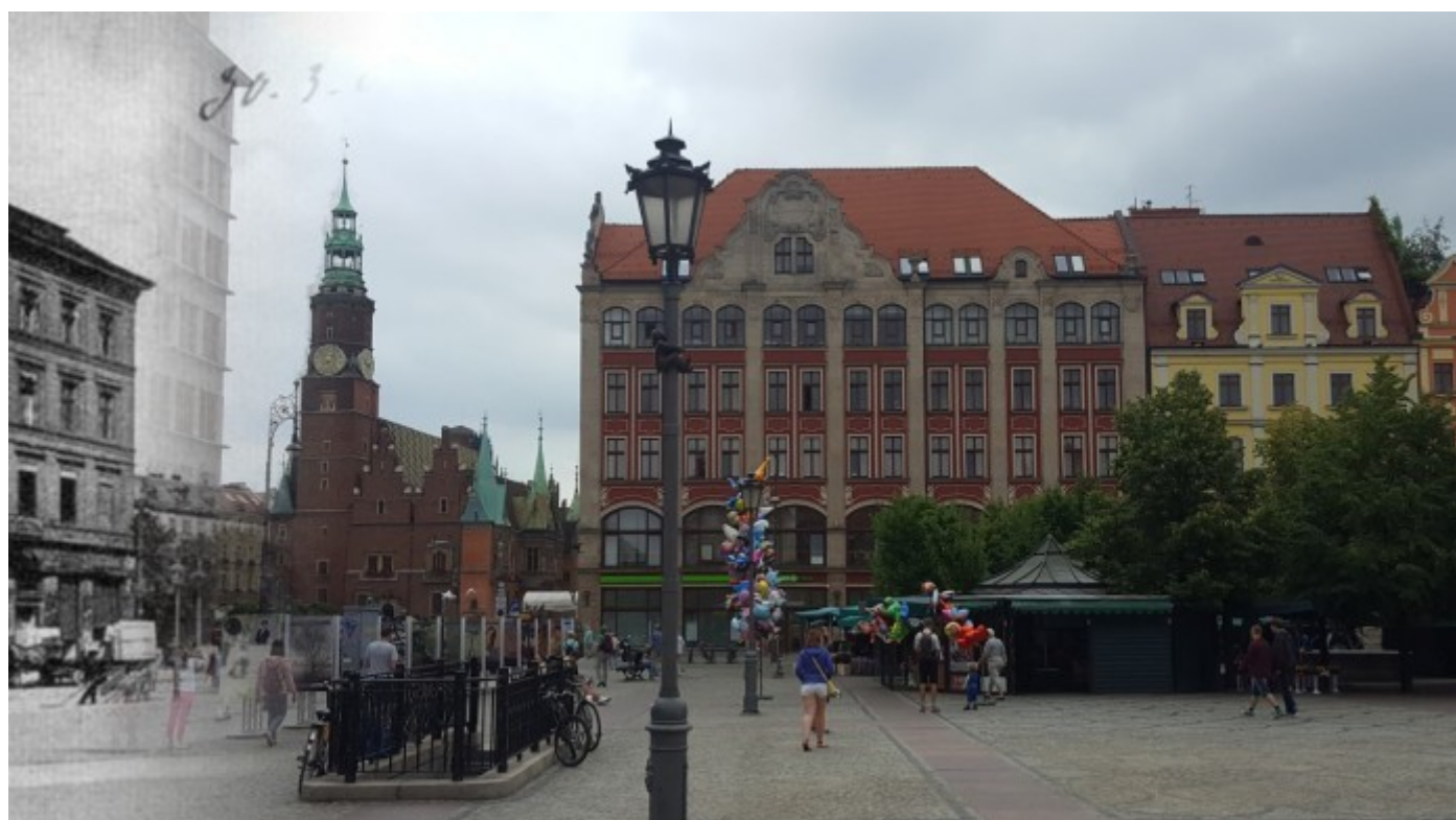
Plac Solny dawniej i dziś