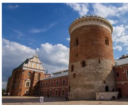
Baszta Zamkowa - Donżon