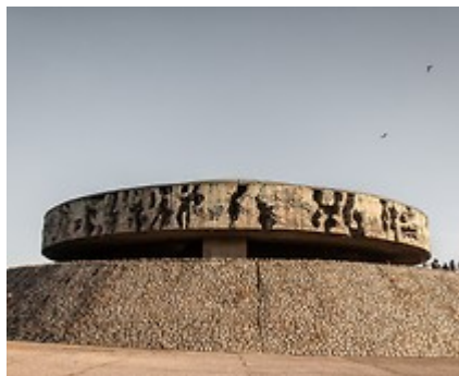
Państwowe Muzeum na Majdanku