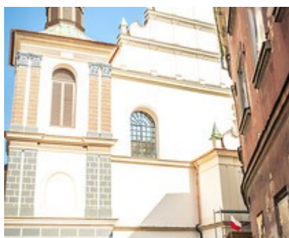
Bazylika oo. Dominikanów pw. św. Stanisława Biskupa i Męczennika