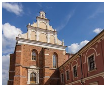
Kaplica Trójcy Świętej