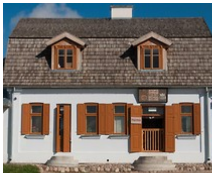
Muzeum Wsi Lubelskiej