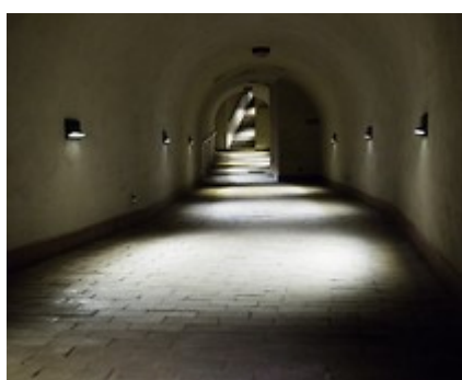
Lubelska Trasa Podziemna