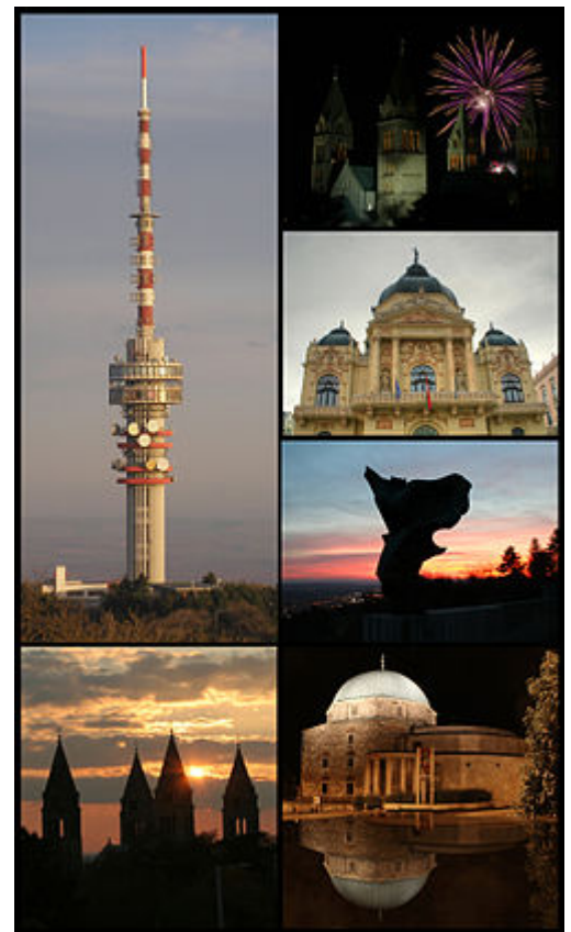
Pécs, Maďarsko, byl Evropským hlavním městem kultury v roce 2010

V roce 1999 bylo Evropské město kultury přejmenováno na Evropské hlavní město kultury a bylo financováno programem Kultura 2000 . 25. května stejného roku evropský parlament navrhl začlenit tuto událost v rámci Evropského společenství a představil nový postup výběru Evropských hlavních měst kultury v období 2005–2019 .